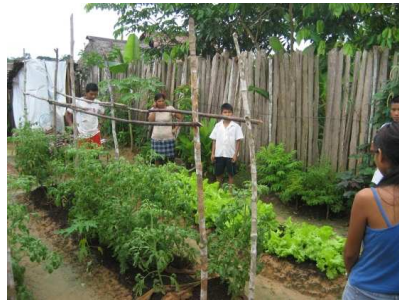
Besichtigung eines Hinterhofs