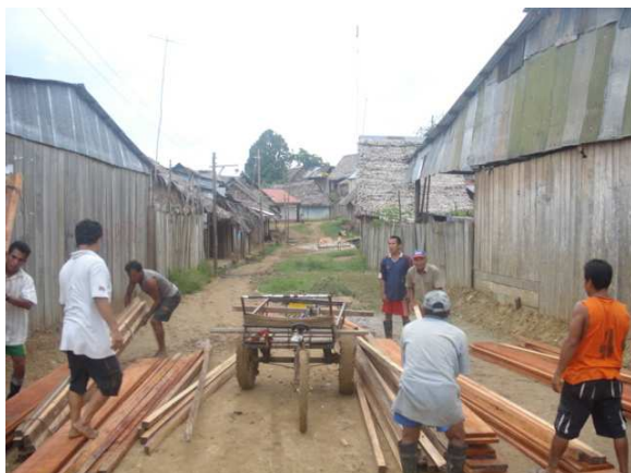
Verladen der Baumaterialien