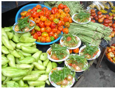
Salat für ein Treffen

Zudem möchten wir, dass über 50% der begünstigten Haushalte dieses Produktionsziel erreichen. Das sekundäre Ziel der Nachhaltigen Bewirtschaftung haben wir gemäss den ersten Auswertungen bei einer grossen Zahl erreicht. Insbesondere freut es uns zu sehen, dass bei Austritt die Produktion nicht gross abfällt und die Zahl derer, die immer noch auf Zielniveau produzieren fast gleich hoch geblieben ist. Beim tertiären Ziel des Transfers sind erste positive Zeichen zu sehen. Da es aber noch methodisch offene Fragen gibt, ist es unklar, ob aus der Befragung Schlüsse gezogen werden können.