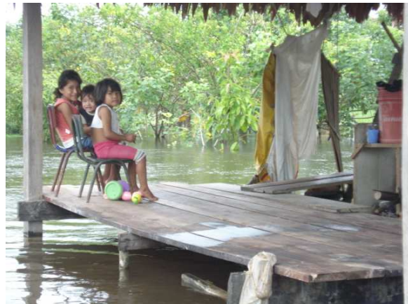
Wohnen auf dem Wasser